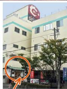
5階建て工場の1階です。